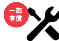
システム連携 開発相談